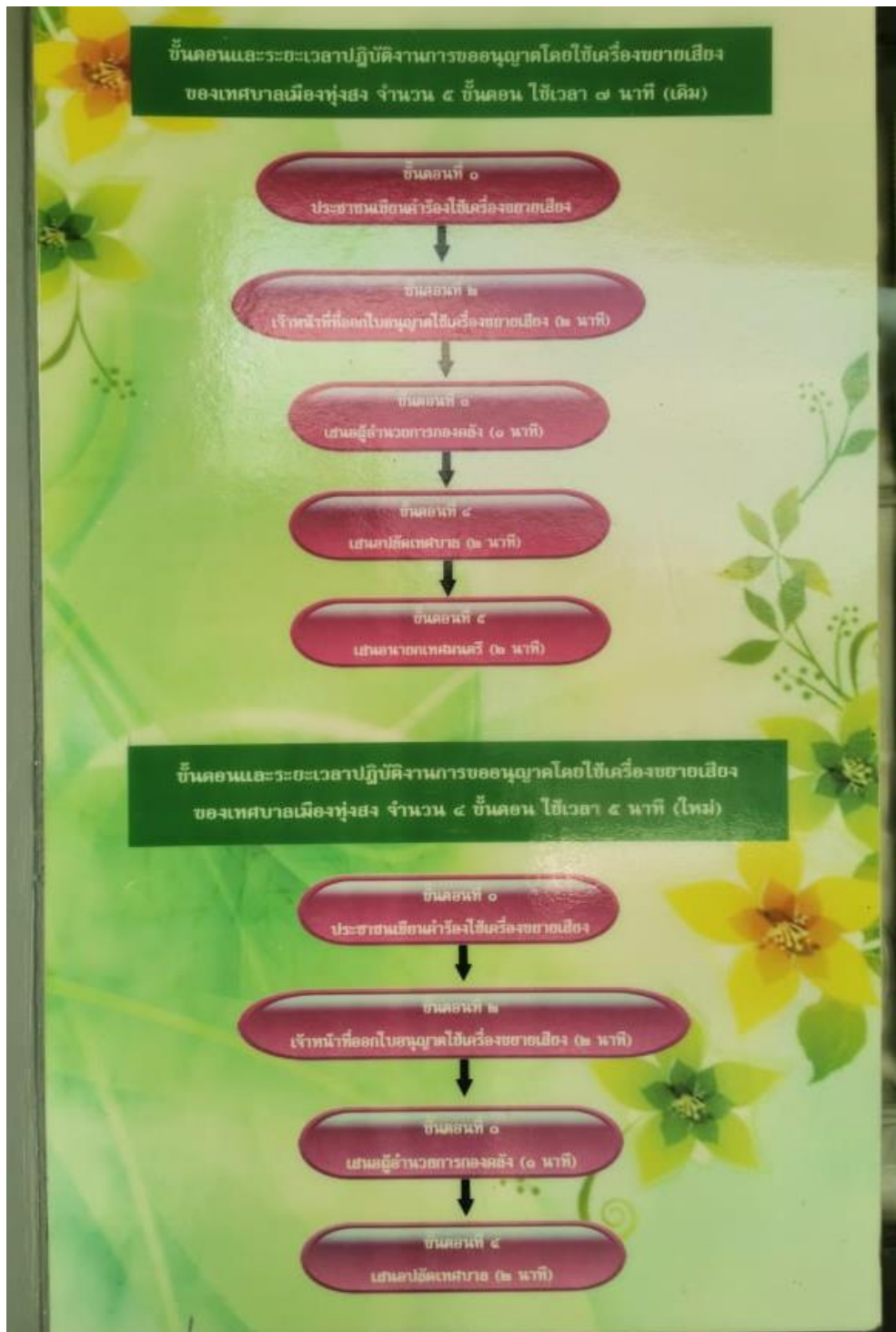
การขออนุญาตใช้เครื่องขยายเสียงของเทศบาลเมืองทุ่งสง