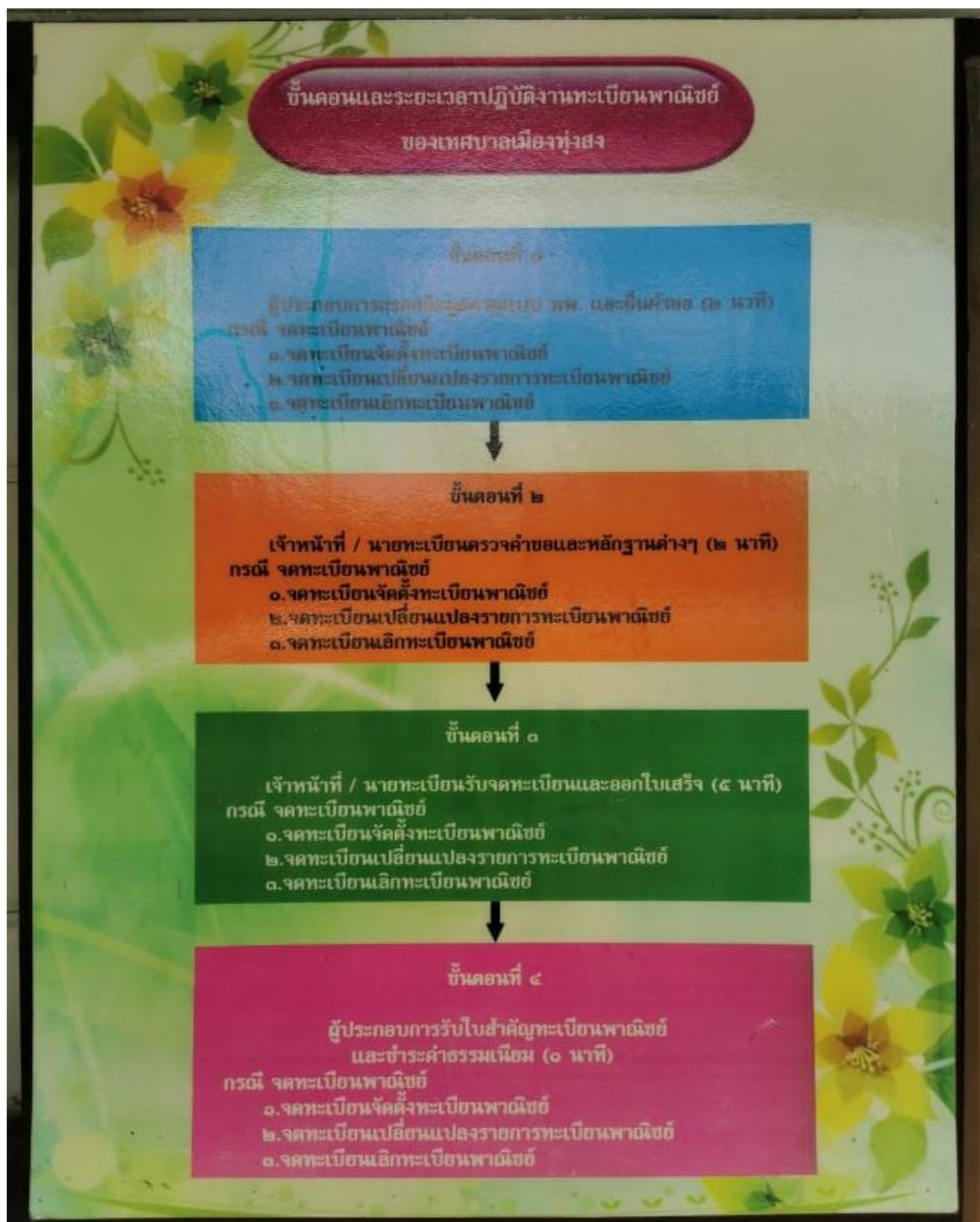
งานทะเบียนพาณิชย์ของเทศบาลเมืองทุ่งสง