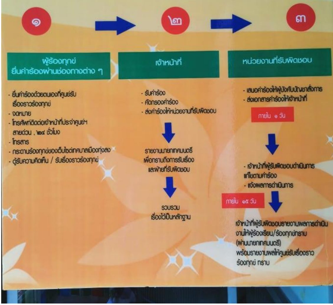
ขั้นตอน/กระบวนการรับเรื่องราวร้องทุกข์ของเทศบาลเมืองทุ่งสง