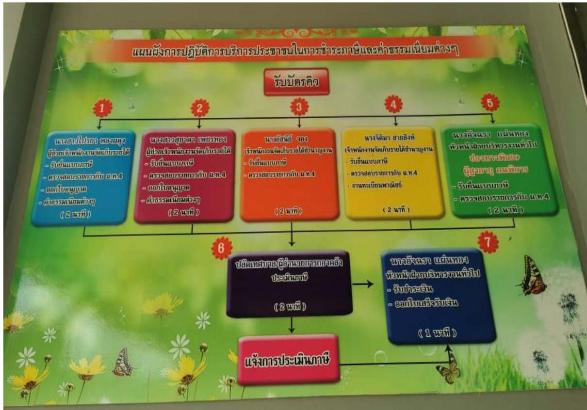
การชำระค่าภาษีและค่าธรรมเนียมต่าง ๆ