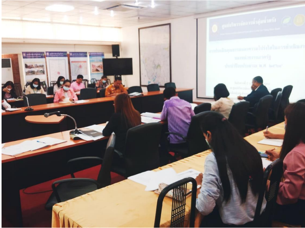
การประชุมเตรียมความพร้อมรับการประเมินคุณธรรมและความโปร่งใสในการดำเนินงานของหน่วยงานภาครัฐ ประจำปีงบประมาณ พ.ศ. ๒๕๖๔ ณ ศูนย์บริหารจัดการน้ำลุ่มน้ำตรัง เทศบาลเมืองทุ่งสง