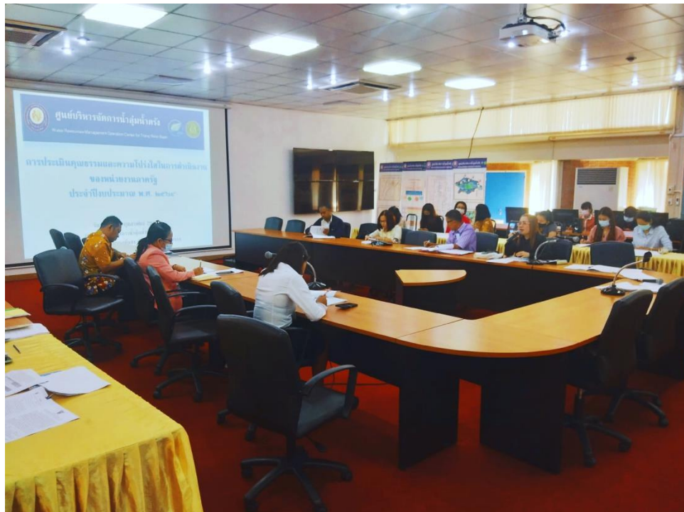
การประชุมเตรียมความพร้อมรับการประเมินคุณธรรมและความโปร่งใสในการดำเนินงานของหน่วยงานภาครัฐ ประจำปีงบประมาณ พ.ศ. ๒๕๖๔ ณ ศูนย์บริหารจัดการน้ำลุ่มน้ำตราง เทศบาลเมืองทุ่งสง