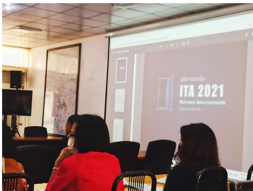
การประชุมเตรียมความพร้อมรับการประเมินคุณธรรมและความโปร่งใสในการดำเนินงานของหน่วยงานภาครัฐ ประจำปีงบประมาณ พ.ศ. ๒๕๖๔ ณ ศูนย์บริหารจัดการน้ำลุ่มน้ำตรัง เทศบาลเมืองทุ่งสง