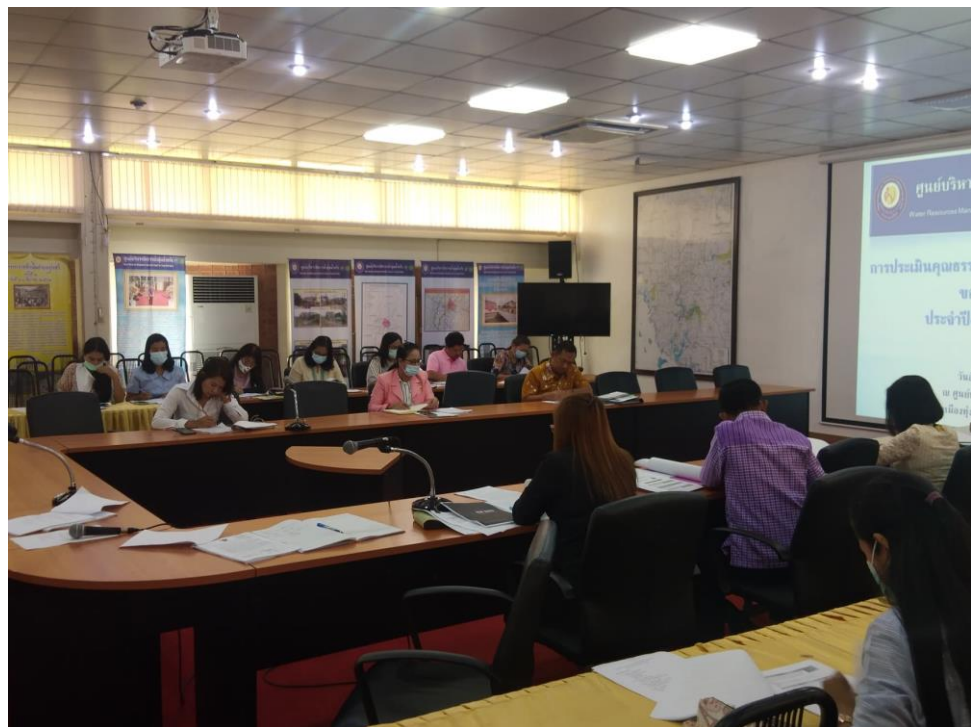
การประชุมเตรียมความพร้อมรับการประเมินคุณธรรมและความโปร่งใสในการดำเนินงานของหน่วยงานภาครัฐ ประจำปีงบประมาณ พ.ศ. ๒๕๖๔ ณ ศูนย์บริหารจัดการน้ำลุ่มน้ำตรัง เทศบาลเมืองทุ่งสง