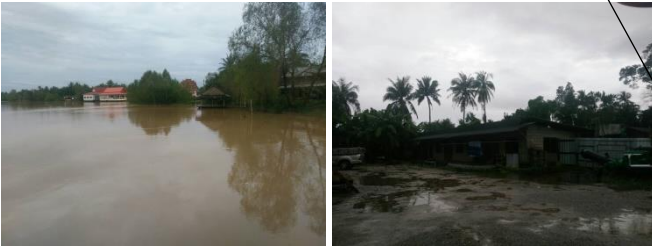
ชุมชนลีเล็ด อ.พุนพิน จ.สุราษฎร์ธานี