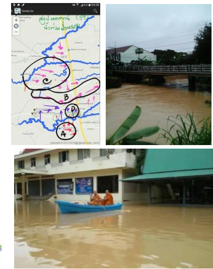
ชุมชนลุ่มน้ำป่าพะยอม อ.ป่าพะยอม จ.พัทลุง