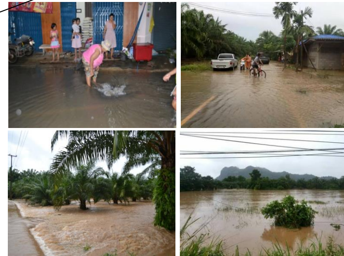
ชุมชน อ.ประเทวี จ.ชุมพร