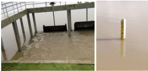
ด.พรอน อ.เมืองปัตตานี จ.ปัตตานี