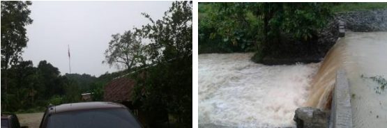
ชุมชนปากชวด อ.บ้านตาขุน จ.สุราษฎร์ธานี