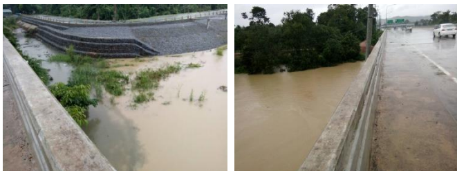
สะพานท่าสาป ด.พรอน อ.เมืองปัตตานี จ.ปัตตานี