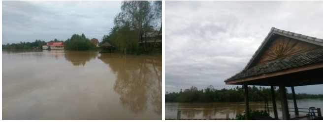
ชุมชนลีเล็ด อ.พนพิณ จ.สุราษฎร์ธานี