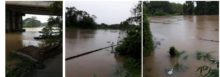
ชุมชนปะกาสะรัง อ.เมืองปัตตานี จ.ปัตตานี