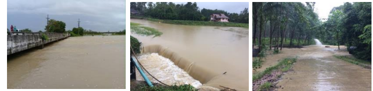
บ้านป่าหัวเขี้ยว