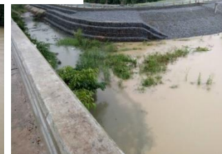
สะพานท่าสาป ต.พร่อน อ.เมืองปัตตานี จ.ปัตตานี