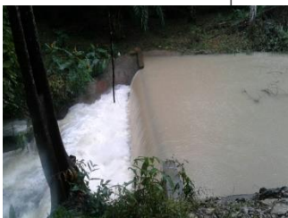
ชุมชนปากซวด อ.บ้านตาขุน จ.สุราษฎร์ธานี