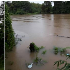
ชุมชนปะกาสะรัง อ.เมืองปัตตานี จ.ปัตตานี