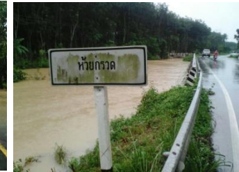
ชุมชนลุ่มน้ำป่าพะยอม อ.ป่าพะยอม จ.พัทลุง