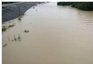
แก้มลิงพร่อน ต.พร่อน อ.เมืองปัตตานี จ.ปัตตานี