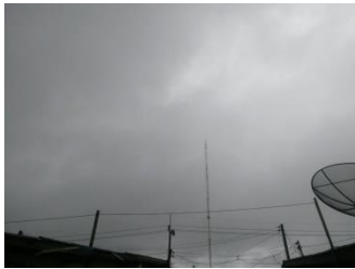
ชุมชนลีเล็ด อ.พุนพิน จ.สุราษฎร์ธานี