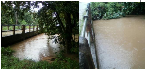
ชุมชนทับคริสต์ อ.พนม จ.สุราษฎร์ธานี