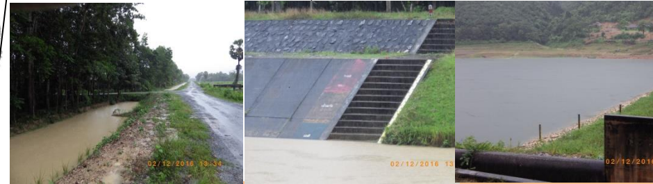
ชุมชนลุ่มน้ำป่าพะยอม อ.ป่าพะยอม จ.พัทลุง