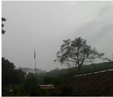
ชุมชนปากชวด อ.บ้านตาขุน จ.สุราษฎร์ธานี