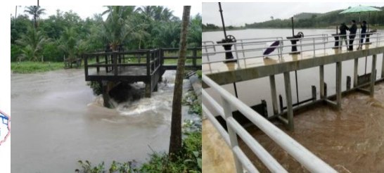
ต.พร่อน อ.เมืองยะลา จ.ยะลา