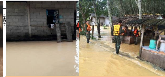
ต.ปากแพรก อ.ทุ่งสง จ.นครศรีธรรมราช