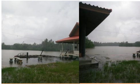
ชุมชนลีเล็ด อ.พุนพิน จ.สุราษฎร์ธานี