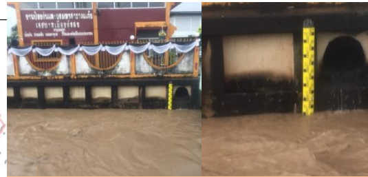
ต.ปากแพรก อ.ทุ่งสง จ.นครศรีธรรมราช