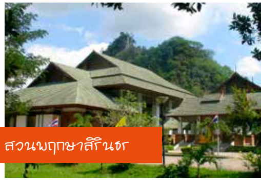
สวนนกพญาสิรินธร

Talod Cave faces the north and visitors can walk through. At the top there are fascinatingly attractive stalagmites and stalagmites. On the way there is a big reclining Buddha Statue with the head pointing to the south and with the length of 11 m. There are also a number of Buddha statues nearby. All are of ancient art with perfect conditions. On the wall there are also murals about the life of Buddha by the artist Naep Tichinnapong. In addition, at the middle of the entrance, there is a big beautifully-carved statue of lion which is unique and breathtaking.