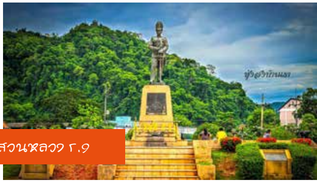
สวนหหลวง ๙.๙

เป็นสวนสาธารณะที่มีความสวยงาม มีดอกไม้หลากหลายชนิดและออกดอกสวยงามให้ชื่นชม ถือเป็นสวนสาธารณะที่สวยงามที่สุดในเมือง สวนสาธารณะแห่งนี้สร้างขึ้น เพื่อเกิดพระเกียรติรัชกาลที่ 5 จึงเป็นที่ตั้งของพระบรมราชานุสาวรีย์ของพระองค์ท่านและได้มีการนำหีวงรถไฟโบราณ ที่เคยใช้ในสมัยสงครามโลกครั้งที่ 2 มาตั้งไว้ในบริเวณสวนสาธารณะแห่งนี้ เพื่อแสดงให้เห็นว่าเมืองทุ่งสงเป็นชุมชนทางรถไฟเก่าแก่ และมีความเจริญ เข้ามาในเขตอำเภอทุ่งสงเป็นเวลายาวนานแล้ว